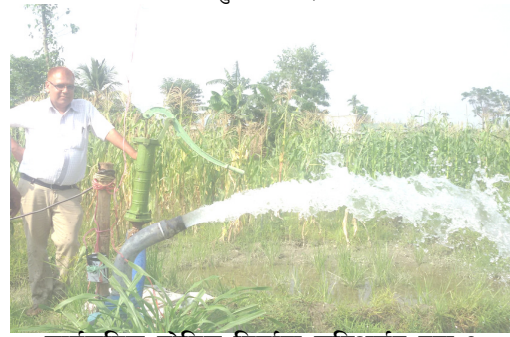
सार्वजनिक चोरिड निर्माण शनिअर्जुन नपा १