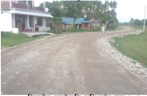
रिडरोड स्तरोन्नति शनिअर्जुन नपा १, २