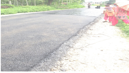
कालोपत्रे शनिअर्जुन नपा ९,

आ.व. २०७२/०७३ तथा आ.व. २०७३/०७४ मा संचालित विकासका केही भलकहरु