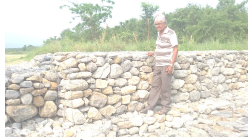
तटबन्धन शनिअर्जुन नपा ३