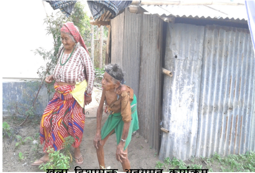
खुला दिशामुक्त अनुगमन कार्यक्रम