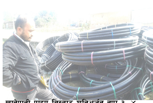
खानेपानी पाइप विस्तार शनिअर्जुन नपा ३, ४